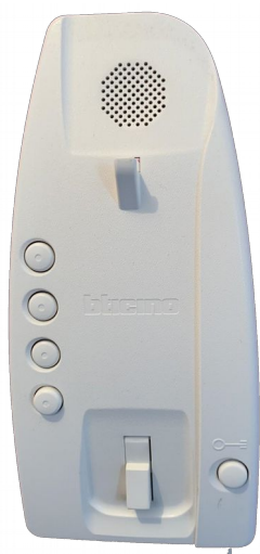
Photo vue d'ensemble interphone / prise ou tableau électrique

Photos de votre interphone intérieur et extérieur