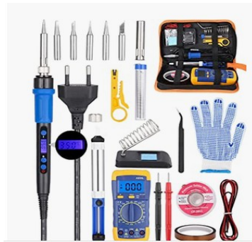
Exemple de Kit "fer à souder" sur amazon pour moins de 30€