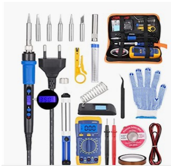
Exemple de Kit "fer à souder" sur amazon pour moins de 30€